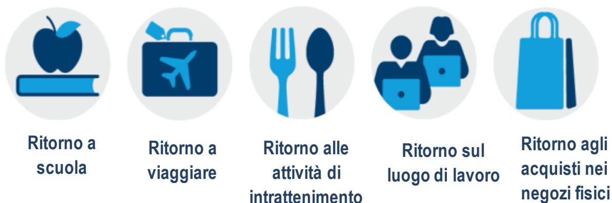
Figura 2: Monitorare gli input

Il nostro indice suggerisce che siamo ancora del 28% sotto i livelli di attività pre-Covid. I livelli delle diverse attività che compongono l'indice variano: il ritorno ai negozi fisici è del 18% al di sotto del livello pre-crisi mentre per un normale ritorno alla routine lavorativa manca ancora il 23%. La componente più in sofferenza è quella dei viaggi/intrattenimento, in calo del 43% rispetto ai livelli pre-Covid.